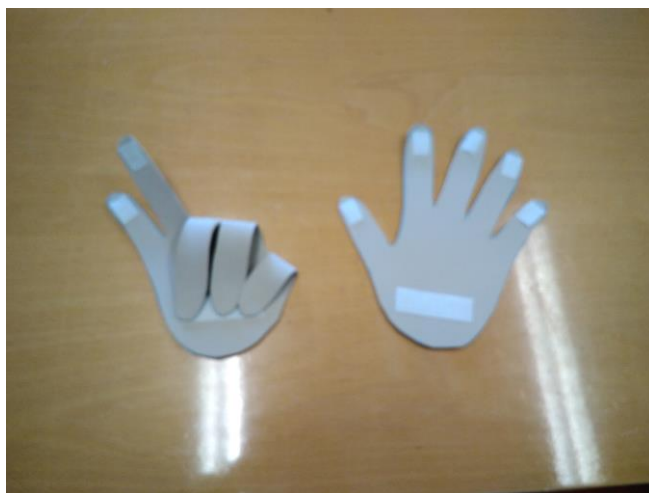
Dos manos para poder hacer restas y sumas