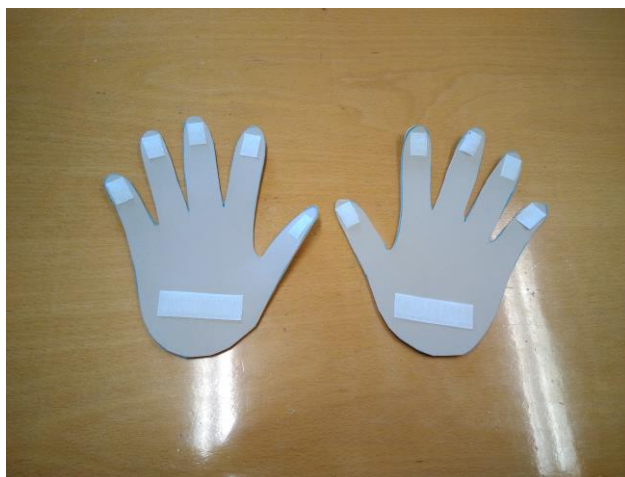
Manos auxiliares para hacer sumas y restas.